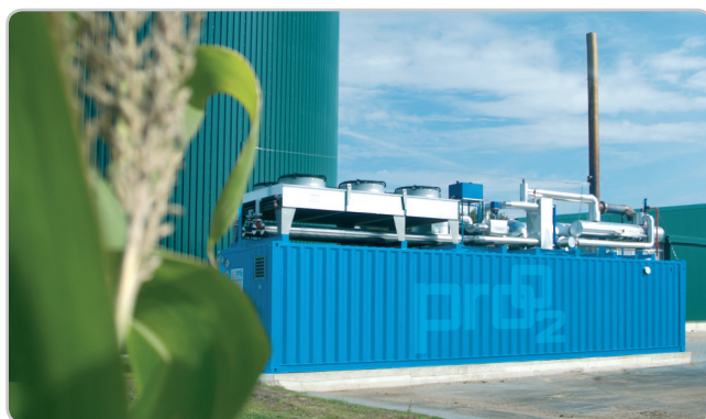
Werden Sie Akteur auf dem Strommarkt

Die Direktvermarktung, die der klassischen Einspeisevergütung gegenüber steht, bietet Ihnen als Biogasanlagebetreiber die Möglichkeit, selbst produzierten Strom eigenständig an Dritte zu verkaufen. Eine Option, die bereits im EEG 2009 verankert ist. Mit dem Inkraft-