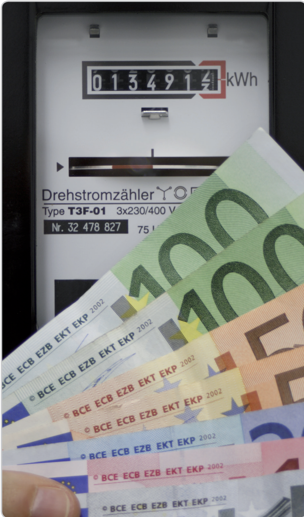
Neue Einnahmemöglichkeiten für Biogasanlagenbetreiber: Direktvermarktung nach dem EEG 2012